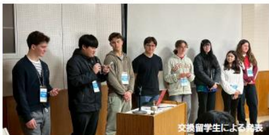
交換留学生による発表