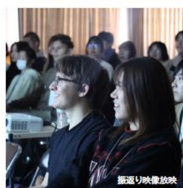
振り返り映像放映