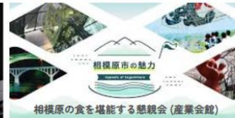
相模原市の魅力 相模原の食を堪能する懇親会(産業会館)