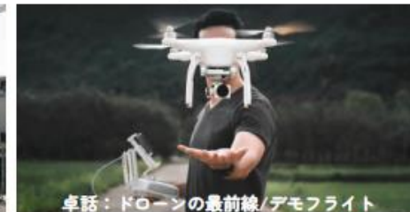
卓話：ドローンの最前線/デモフライト