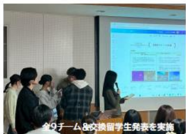
全9チーム8交換留学生発表を実施