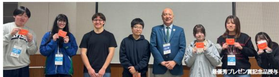
最優秀プレゼン賞記念品授与