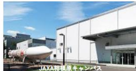
JAXA相模原キャンパス